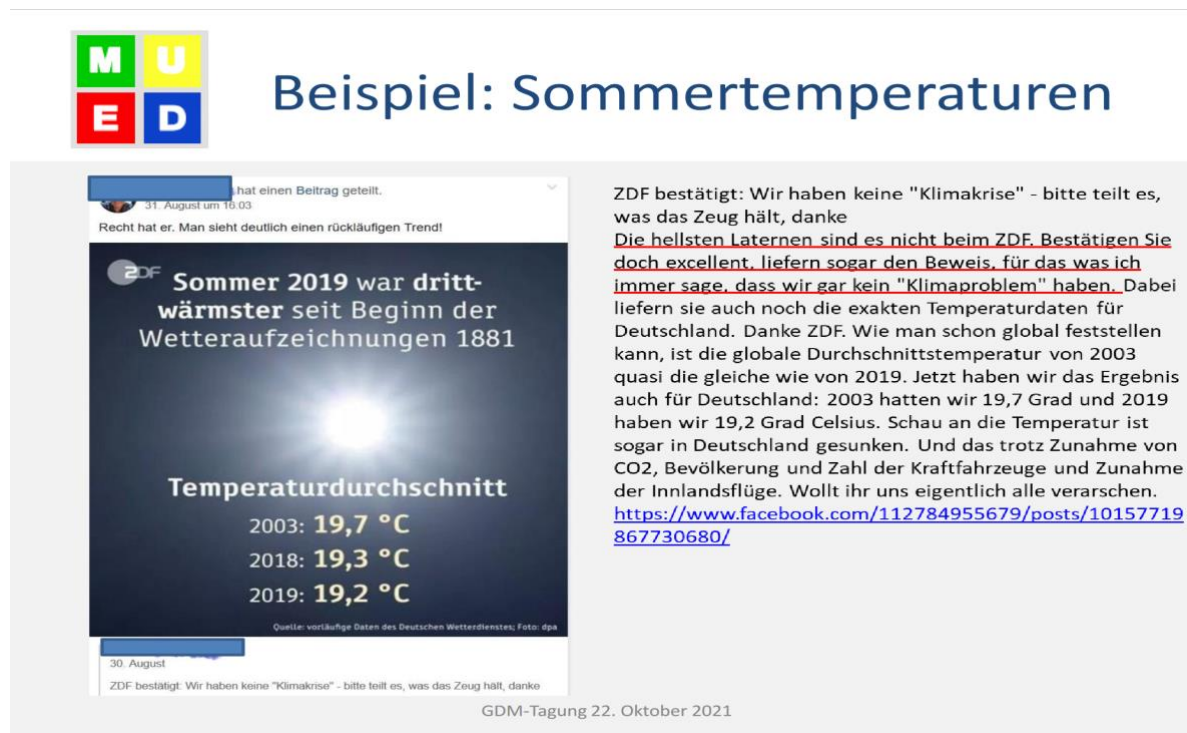
Abb.1: Sommertemperaturen - Fake News aus dem Internet

Ich bin gespannt, welche Beispiele Ihre Schulklasse findet. Ich habe für diesen Text eines ausgewählt, das A. Warmeling (ein langjähriges und engagiertes Mitglied der MUED – siehe www.mued.de ) im Rahmen der Jahrestagung des Arbeitskreises „Mathematik und Bildung“ zum Thema „Mathematik, Gesellschaft und Wahrheit“ am 22.10.2021 vorgetragen hat: „Fake News entlarven – manchmal hilft Mathematik ...“. Folie 7 seines Vortrages zeigt ein Beispiel aus dem Internet: